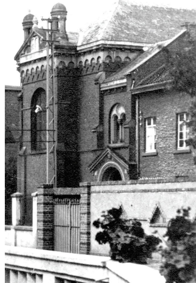
Die ehemalige Geilenkirchener Synagoge