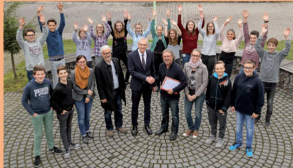
Der Kurs „Energie und Umwelt“ bei der Unterzeichnung der Kooperationsvereinbarung im Forschungszentrum Jülich.

Der Kurs „Energie und Umwelt“ wird in Kooperation mit dem Schülerlabor „JuLab“ des Forschungszentrums Jülich im Wahlpflichtbereich der Mittelstufe angeboten. Die Schülerinnen und Schüler entwickeln und erarbeiten zunächst unter Anleitung, dann immer selbstständiger Fragestellungen und Experimente zu den Themen „Energie und Umwelt“. Der Unterricht in der Schule wird ergänzt durch die Arbeit im „JuLab“ und Besuche in verschiedenen Instituten des Forschungszentrums.