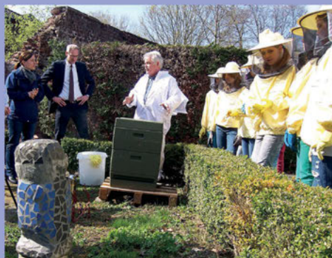
Honig aus eigener Herstellung: unsere Bienen-AG in voller Montur!