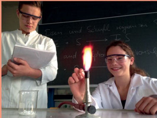
Entdeckendes Lernen im Chemie- bzw. Biologieunterricht