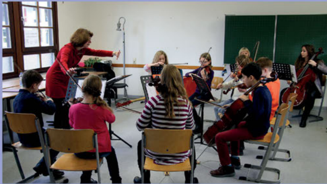
Streicherprojekt: (gemeinsame) Übung macht den Meister!

Schwerpunkte bilden dabei die verschiedenen Musikensembles für alle Altersgruppen, naturwissenschaftliche Arbeitsgemeinschaften, spezielle Angebote im sprachlichen und