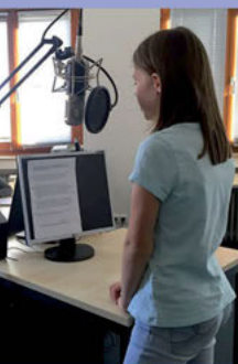
Radio-AG – eine AG ab Klasse 5