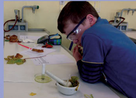
Forscher-AG – eine neue AG ab Klasse 5