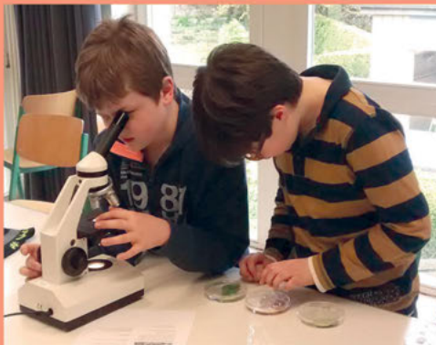
Hilf mir, es selbst zu tun – Oberstufenschülerinnen und Oberstufenschüler unterstützen ihre jüngeren Mitschülerinnen und Mitschüler im Tutorium bei den Hausaufgaben.

Wir unterstützen die neuen Schülerinnen und Schüler durch eine Orientierungsstunde mit Methodentraining (Klasse 5) bzw. durch besondere Unterrichtsangebote für die ehemaligen Realschülerinnen und Realschüler (Jahrgangsstufe EF).