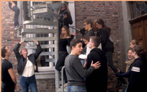
Das Fach Literatur bietet verschiedene Möglichkeiten, sich künstlerisch-praktisch zu betätigen (hier: Literaturkurs mit Schwerpunkt Theater).