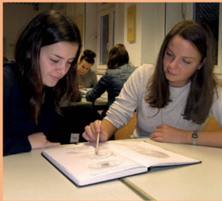
Beratung einzelner Schülerinnen und Schüler – im Unterricht und darüber hinaus

Fachunterricht und besonderer Förderunterricht ermöglichen dabei individuelle Lernwege. Zur individuellen Förderung gehört für uns auch, dass