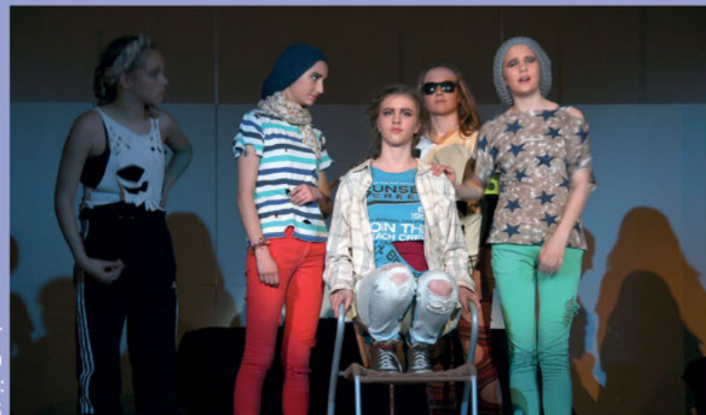
Seit mehr als 25 Jahren eine feste Größe: unsere Theater-AG