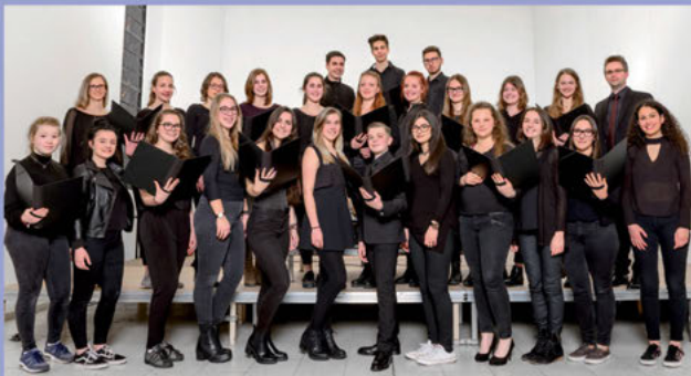
Unser Kammerchor stellt eine herausragende Förderung der Gesangsausbildung dar.