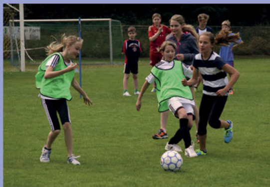
Schon lange bei uns ein Thema: Mädchen spielen Fußball!

Unser umfangreiches Angebot an Musikensembles umfasst Chöre, Big Band und Orchester, jeweils mit speziellen Angeboten für jüngere Schülerinnen und Schüler, auch für Anfänger ohne Vorkenntnisse (Streicherprojekt). Neben den Konzerten sind die Auführungen der Theater-AG und des Literaturkurses „Theater“ der Jahrgangsstufe Q1 Höhepunkte des Schuljahres. Von Schülerinnen und Schülern geschaffene Kunstwerke werden auf dem Schulgelände und im Schulgebäude ausgestellt.