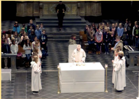
In der benachbarten Pfarrkirche St. Marien feiert unsere Schulgemeinde ihre Gottesdienste.

Miteinander. Es ist unser Anspruch, respektvoll und vertrauensvoll miteinander umzugehen. Wir bemühen uns, immer den ganzen Menschen und seine Lebens-